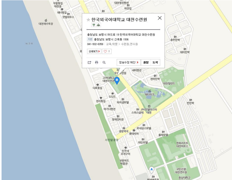
대천수련원 위치 : 충청남도 보령시 머드로 19